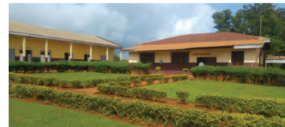
L'hôpital de Bangangté

Les mairies, hôpitaux, établissements scolaires et autres structures publiques voient leur activité perturbée par la mauvaise qualité de la fourniture électrique.