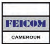
At Service Du Développement Local