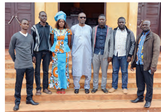
Les ingénieurs et techniciens engagés sur le projet

Le parti pris des partenaires est de s'appuyer principalement sur l'expertise locale en accompagnant les équipes d'une manière ponctuelle et dans les phases cruciales de mise en œuvre. Un chef de projet, un assistant technique international et des ingénieurs ont été recrutés par le REFELA-CAM.