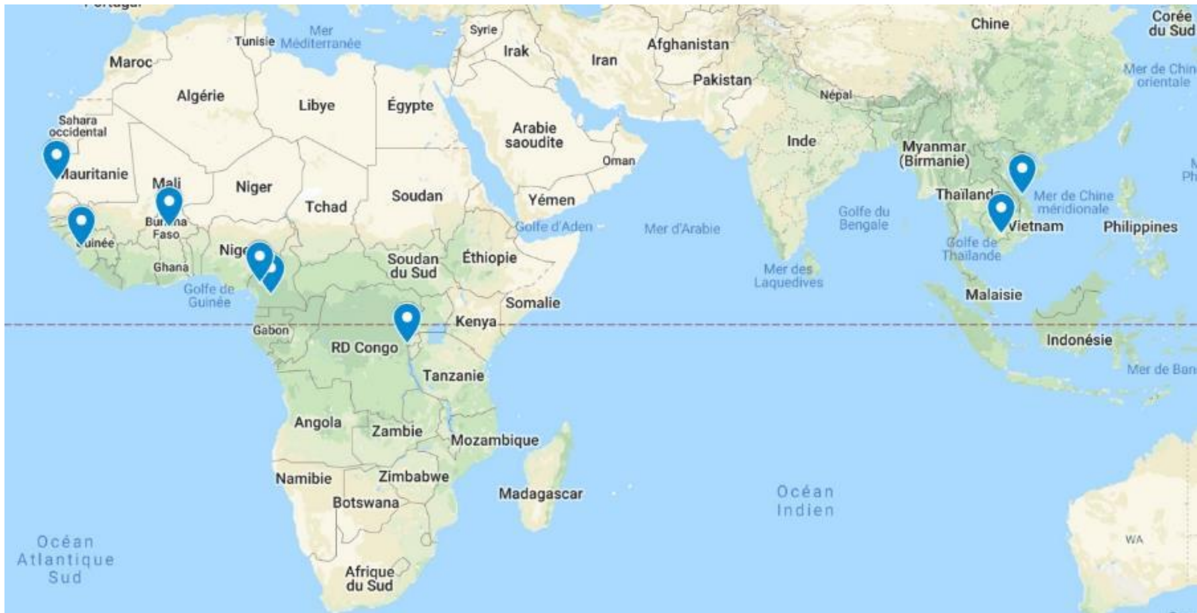
Localisation des 8 projets pilotes GBV de l'ISSV